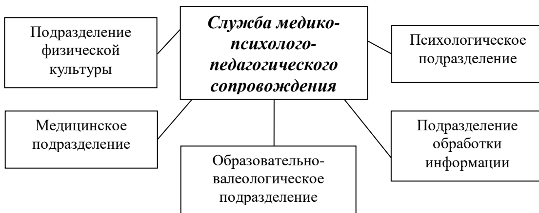
Рисунок. Организационная структура службы медико-психолого-педагогического сопровождения образовательной деятельности в МОУ Октябрьском сельском лицее

Согласно принципа учета функциональных операций, выделено пять основных функций деятельности как службы медико-психолого-педагогического сопровождения в целом, так и ее подразделений, и конкретных исполнителей: диагностико-прогностическая; коррекционная; профилактическая; образовательно-просветительская; научного и информационного обеспечения.